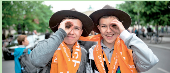
Wir freuen uns auf die gemeinsamen Tage im Juni in Nürnberg

Einer guten Tradition folgend bieten wir für den Deutschen Evangelischen Kirchentag in Nürnberg wieder eine Fahrt für Konfirmanden und Junge Gemeinde an. Sie können sich mit Ihrer Jugendgruppe bei uns anmelden. Wichtig ist, dass Sie für Ihre Gruppe entsprechend ihrer Gruppengröße genügend Betreuer haben; Sie sind selbst für Ihre Gruppe verantwortlich. Wir organisieren für Sie die An- und Abreise mit dem Bus, die Anmeldung beim Kirchentag samt der gemeinsamen Unterkunft in einer Schule. Bitte melden Sie sich umgehend in unserem Büro per mail oder telefonisch, spätestens jedoch bis zum 15. März 2023. Bitte melden Sie sich auch, wenn Sie vorher noch nähere Informationen benötigen. Vielen Dank!